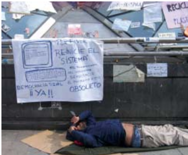
Acampada del 15M en la Puerta del Sol de Madrid.

El desafío consiste en “(des) aprenderse” para pasar de la solidaridad como gestión a la solidaridad como proceso comunicativo-educador. Si el 15-M parece inagotable es por su talento “esencialmente” educador: su meta es construir ciudadanía desde la reclamación de lo concreto y desde la autoorganización abierta. ¿Será entonces que esa sociedad que ahora busca retornar siempre estuvo ahí, siempre fue “multitud”, pero no siempre supimos verla?