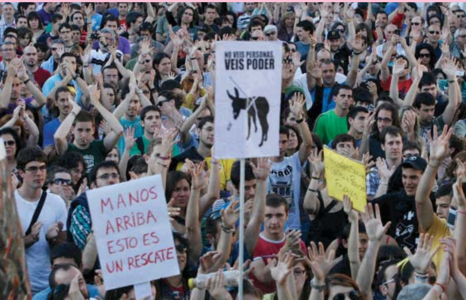
Manifestación en la Plaza del Castillo de Pamplona del movimiento 15M.

tienen poco alcance), y otro tipo de instituciones (la “crisis institucional”). Una sociedad de este tipo –la “sociedad red”– sólo puede pensarse desde la incertidumbre como oportunidad, desde la creatividad, la innovación y la participación social.