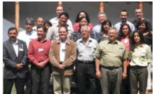
Participantes en el taller de Guatemala 2011.

"Bolivia puede dar y recibir mucho en este proyecto. En nuestro país estamos desarrollando el SAFCI, un modelo que incluye perspectiva como la interculturalidad que prevista en el nuevo modelo que puede ayudar a introducir otras como el medio ambiente y facilitar su operatividad. Al mismo tiempo, tenemos una amplia experiencia y tradición acumulada sobre modelos de salud integral e incluyente que pueden ayudar a desarrollar un sistema que no solo valga para nuestros tres países sino para gran parte de Latinoamérica, especialmente allá donde haya población excluida del acceso a la salud.