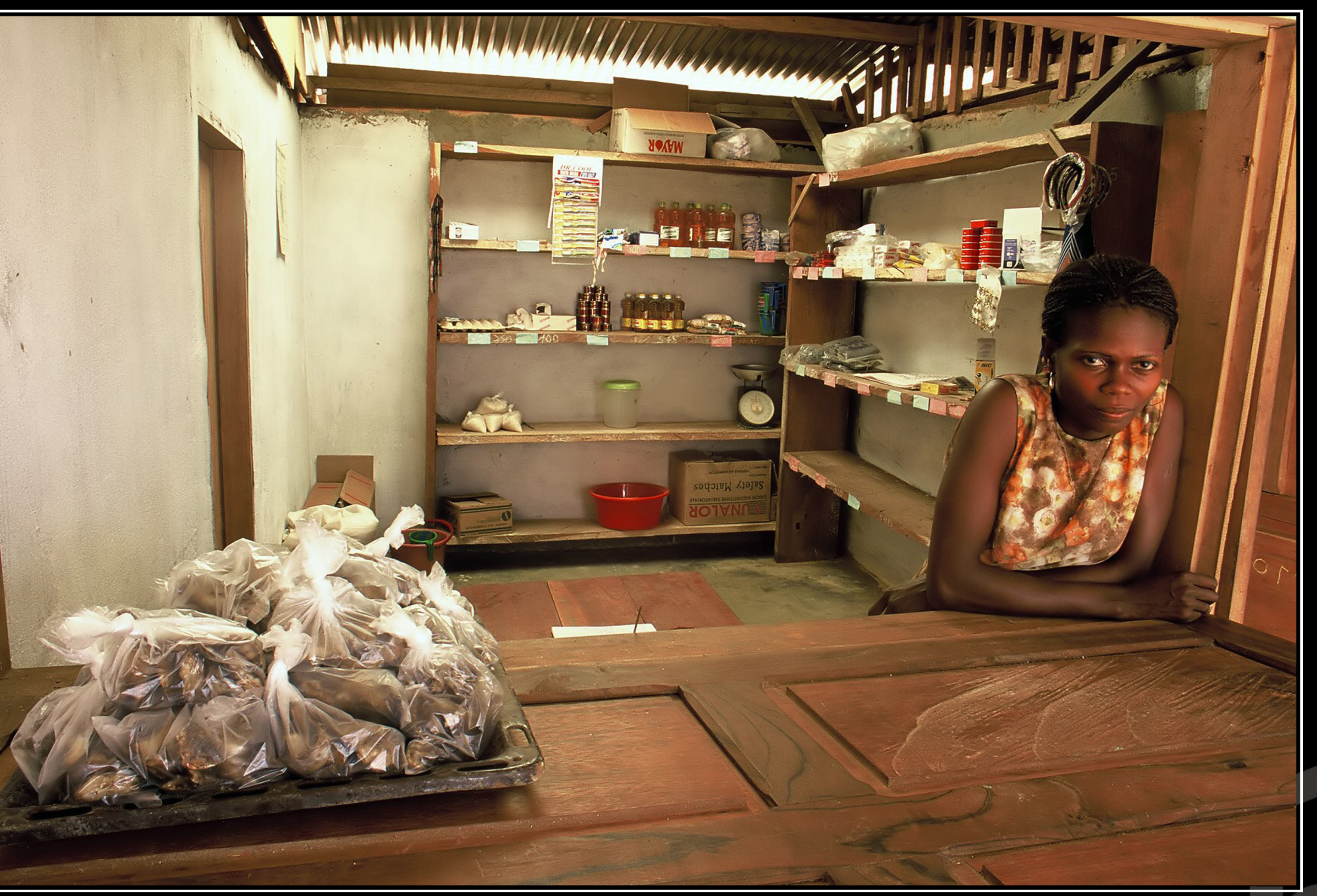
Existencias de la tienda de Ngovayang. Por respeto...