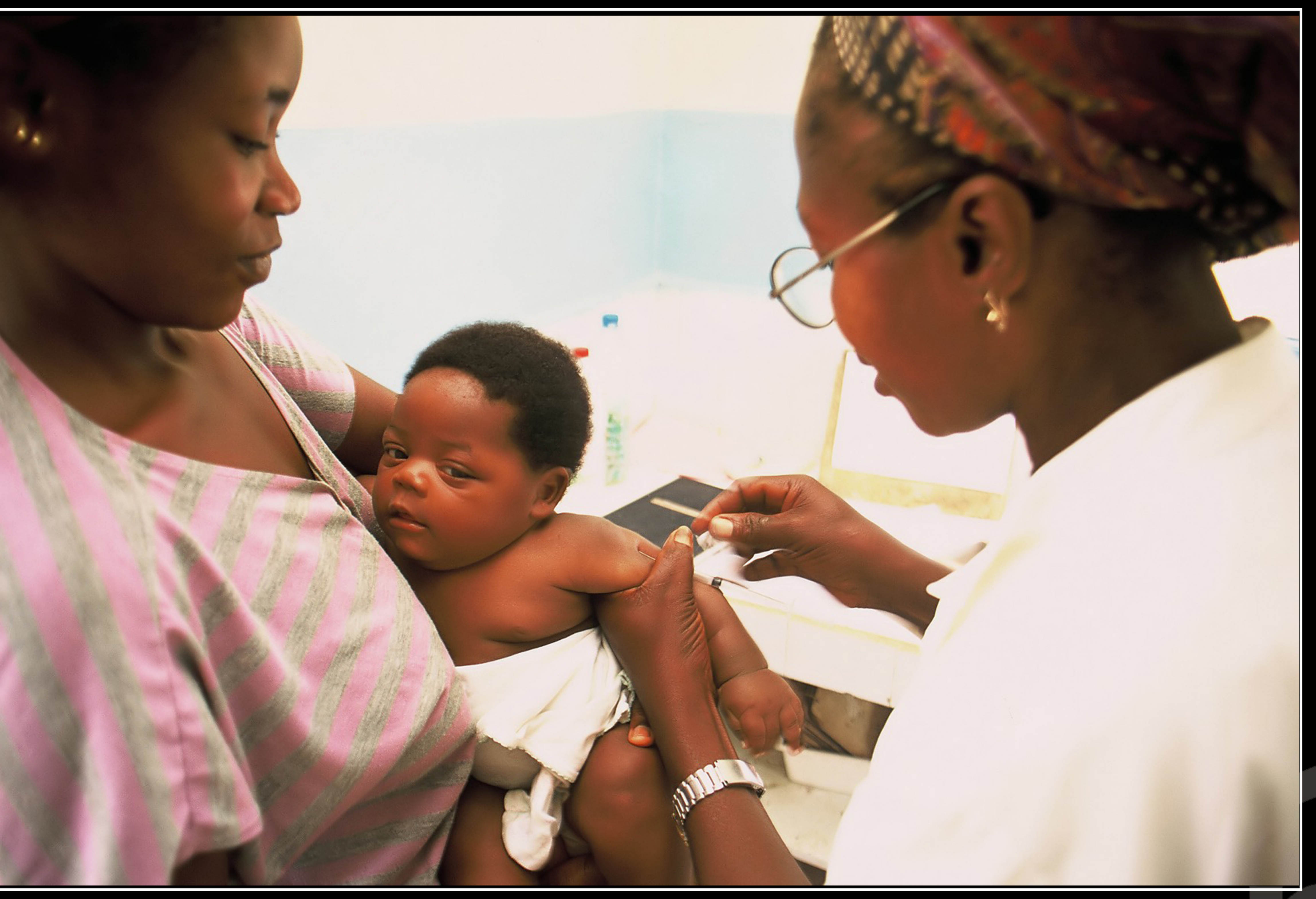
Por encima de otras acciones, allí la prevención es una prioridad.