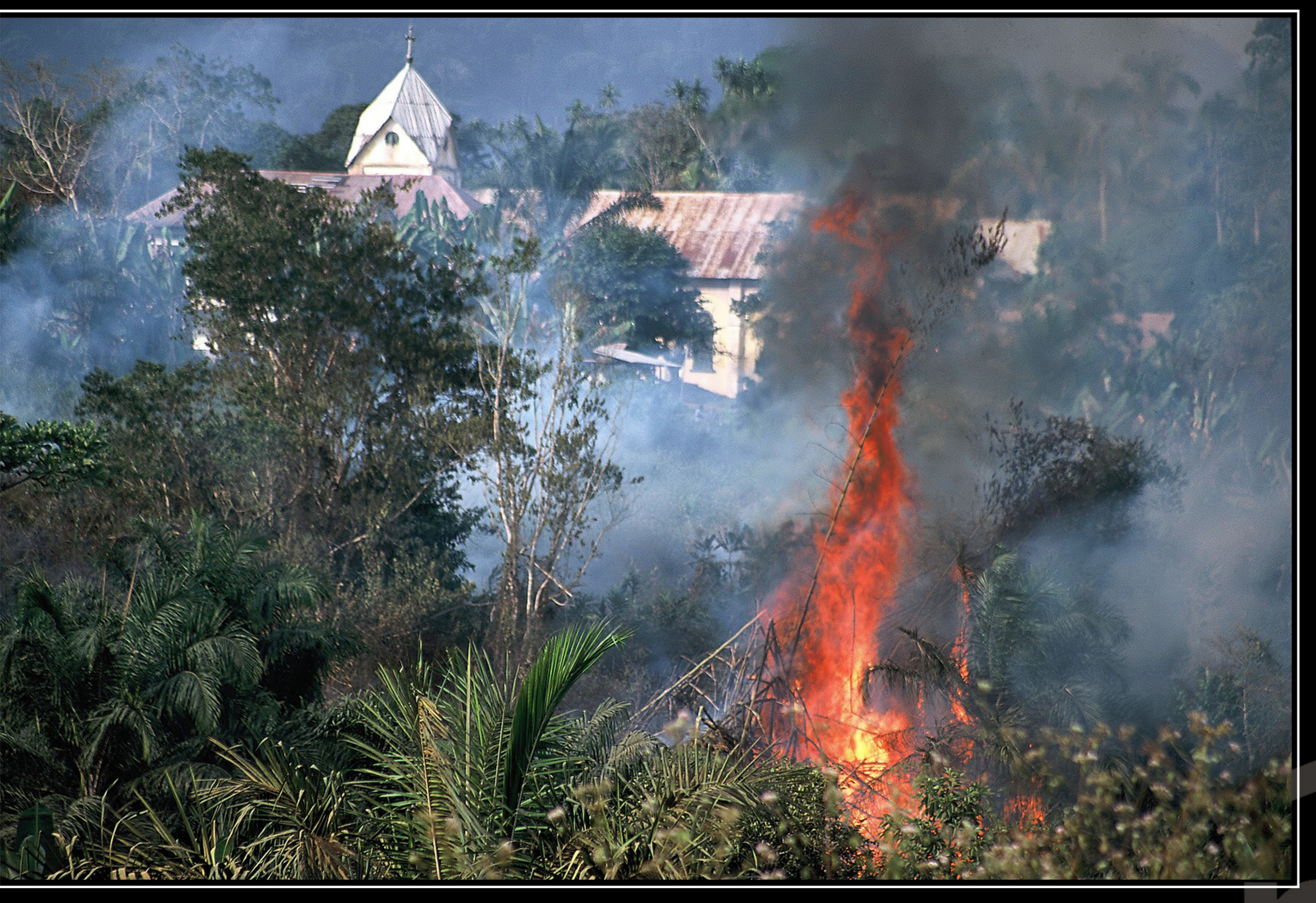
Llamas de 20 metros queman el bambú. Espacio y luz para cultivar.