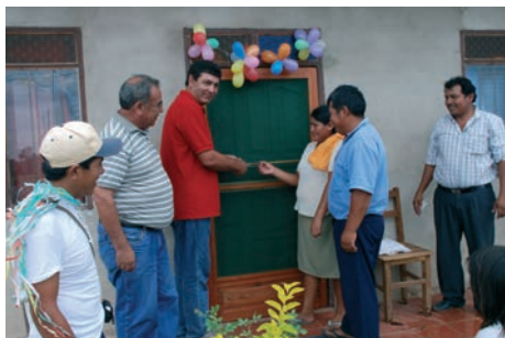
Inauguración de una de las viviendas