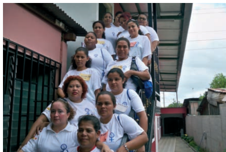
Promotoras de salud de Acahual