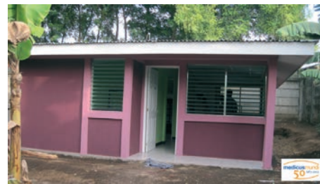
Exterior del albergue "Las golondrinas"