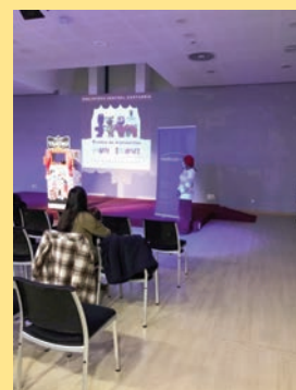
Educación en valores a través de las marionetas Mundinovi

Mundinovi es un set formado por ocho marionetas y treinta y dos guiones de corta duración que plantea situaciones relacionadas con valores como la amistad, la solidaridad, el agradecimiento dirigido a niños y niñas de segundo ciclo de infantil y primer ciclo de primaria. En 2021, la cuentacuentos Mariposanegra actuó con las marionetas Mundinovi de forma presencial y on line en la Biblioteca Central de Cantabria y, a través de las redes sociales, en las bibliotecas de Argoños, Bárcena de Cicero, Comillas y Santillana del Mar. En noviembre los más pequeños del Colegio Cumbres de Santander han disfrutado de los cuentos con estas marionetas.