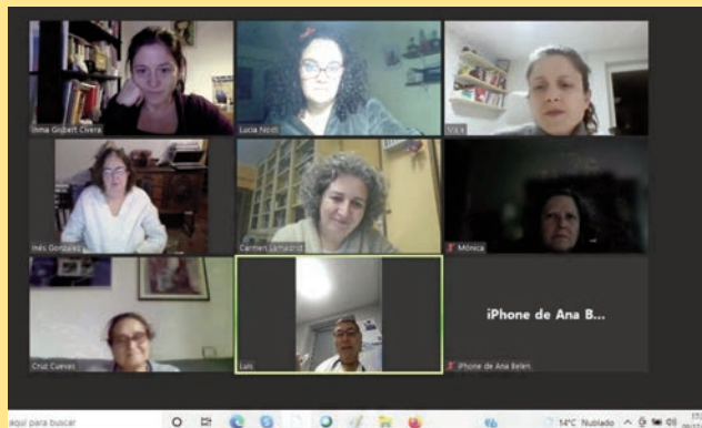
Webinar en el marco del proyecto Aumentando competencias en Educación para la ciudadanía global en el marco del derecho a la salud desde la perspectiva de género