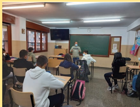
Taller con Los Glayus en el IES López y Vicuña

En el marco de la convocatoria del ayuntamiento de Gijón a proyectos de Educación para el Desarrollo y Sensibilización, se impulsaron a lo largo del año 2021 dos iniciativas. Por una parte la obra teatral Ese virus que no somos , a cargo de la Asociación Cultural Los Glayus, así como los talleres complementarios a la misma, que se desarrollaron el 24 de noviembre en el IES López y Vicuña para alumnado de 2º, 3º y 4º de ESO. Esta iniciativa es una enseñanza sobre la importancia de poner a las personas en el centro en momentos críticos como la crisis sanitaria por COVID19 que nos ha tocado vivir. Por otro lado, el ayuntamiento aprueba el proyecto Globalización y salud: avanzando hacia una salud global , que ha consistido en la edición de un video en el marco de un proyecto con la Federación de Medicus Mundi España y una serie de acciones y charlas en la ciudad para informar y sensibilizar en torno al ODS 3 Salud y Bienestar .