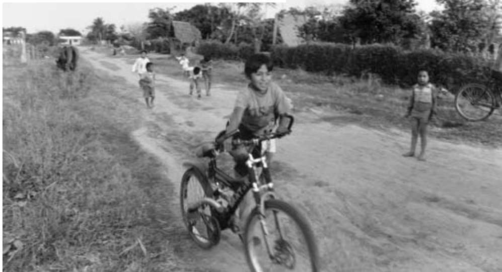
Niños en el Barrio San Miguel, Cuatro Cañadas, Bolivia Antonio Damián Gallego.