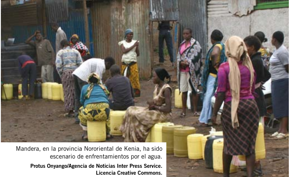
Mandera, en la provincia Nororiental de Kenia, ha sido escenario de enfrentamientos por el agua.