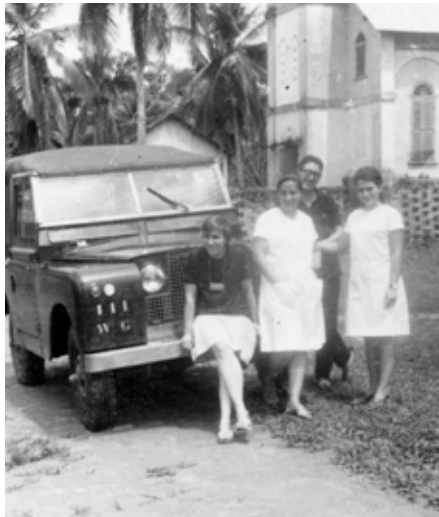
Primer coche para el Hospital de Ngovayang, Camerún, 1966.

Las imágenes valen por mil palabras. Mejor dicho, por mil proyectos, que es el número de las intervenciones que las distintas asociaciones de medicusmundi han realizado en 60 países de África, Latinoamérica y Asia desde 1963. Las 15 asociaciones de la Federación hemos hecho una selección de nuestros archivos fotográficos. Aquí reproducimos una pequeña selección. La completa puede verse en nuestra web.