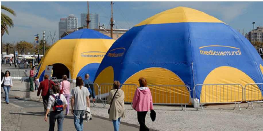
Exposición itinerante "Bus del Milenio" en Barcelona, 2007.