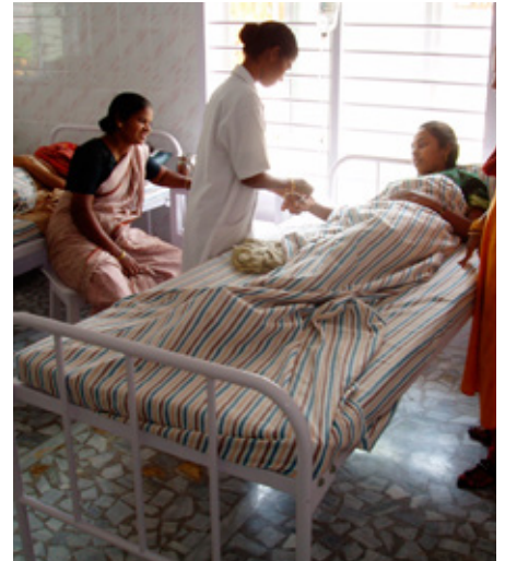
Hospital de Kanyakumari, India, 2004.