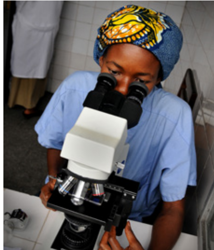
Laboratorio en Kinshasa, República Democrática del Congo, 2008.