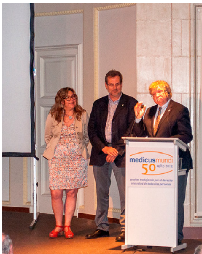
Los tres presidentes en la clausura.