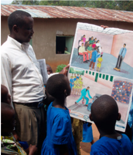
Educación sobre agua y salud en Ruanda, 2006.