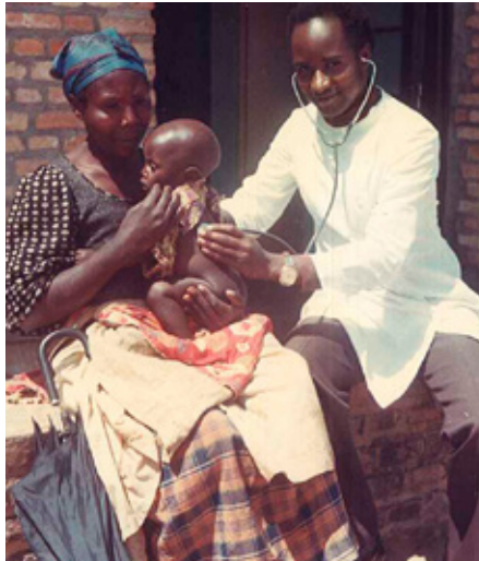
Atención médica y formación en Ruanda, 1985.