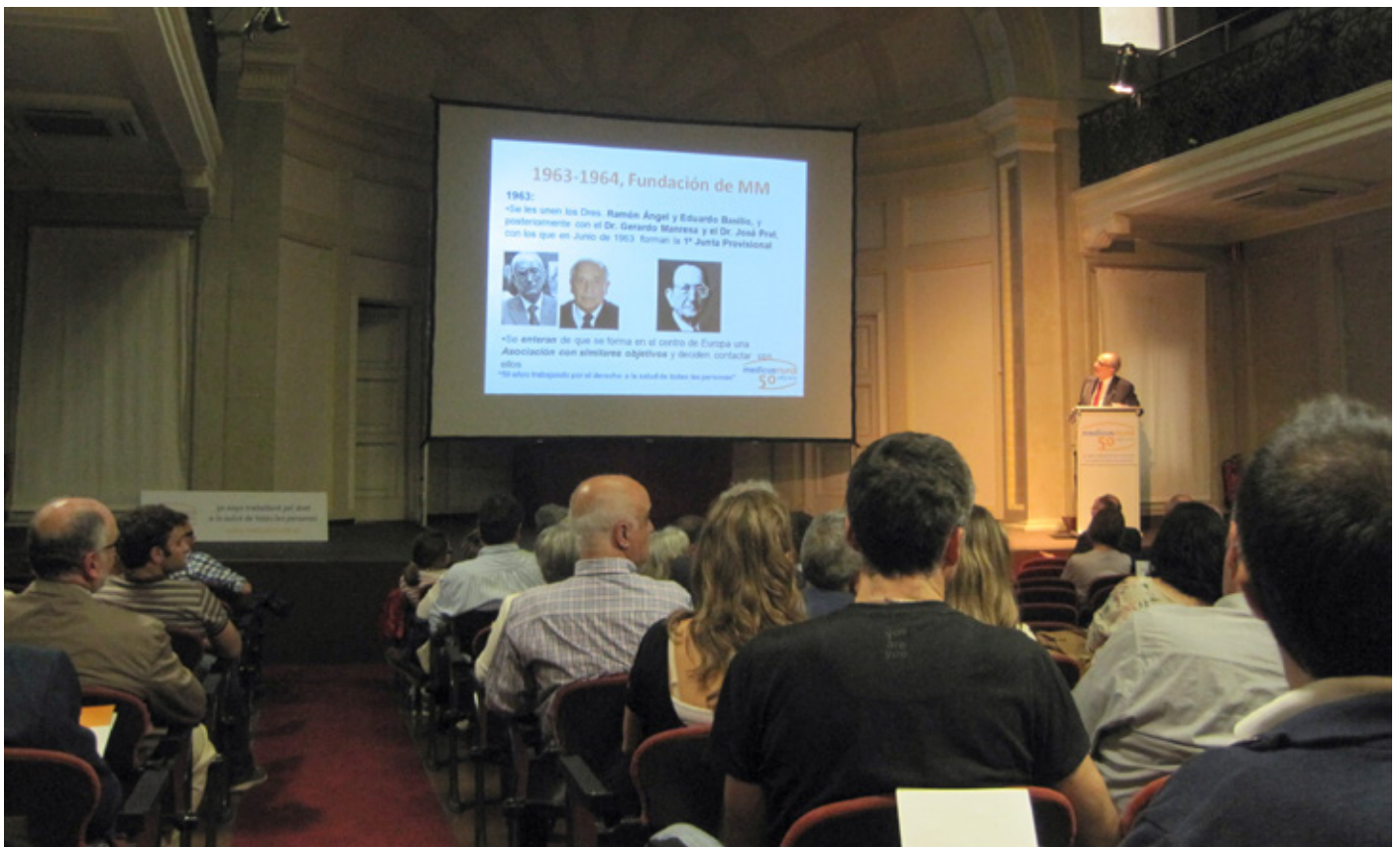
Salón de Actos del Casal del Metge.