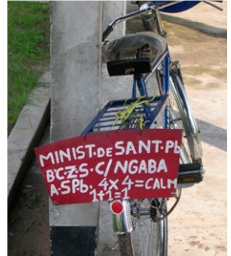
Vehículo sanitario en República Democrática del Congo, 2008.