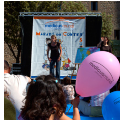
Maratón de cuentos en Barcelona, 2005.