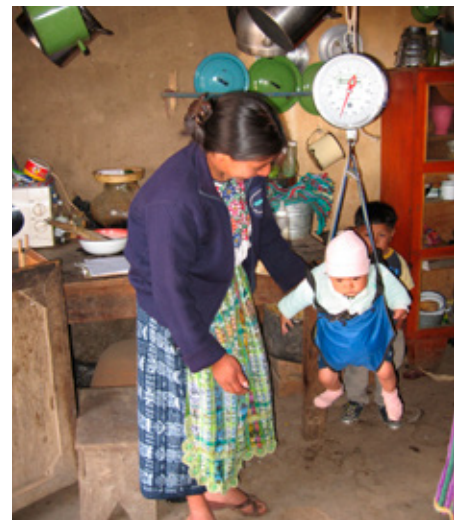
Atención infantil en Guatemala, 2007.