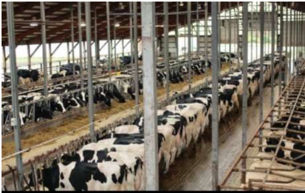
EMISSIONS DE LA RAMADERIA