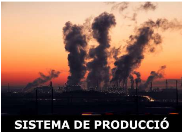
SISTEMA DE PRODUCCIÓ