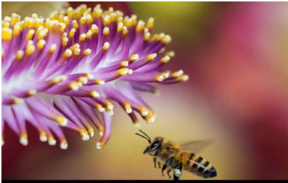
PERDUDA DE BIODIVERSITAT