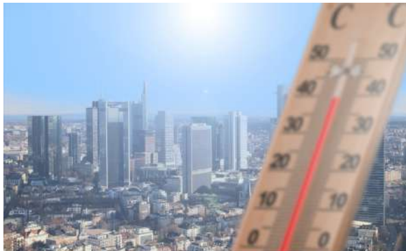
ONADES DE CALOR