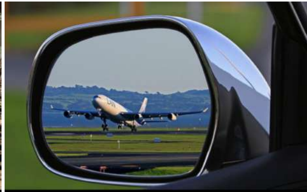
EMISSIONS DEL TRANSPORT