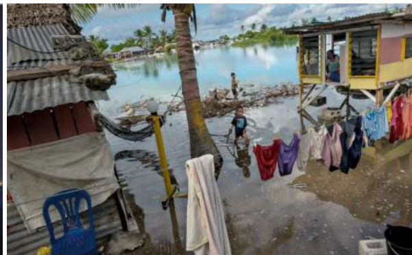
AUGMENT DEL NIVELL DE MAR