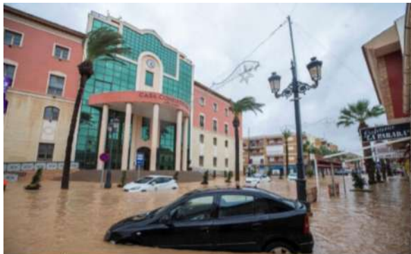
FENÒMENS CLIMÀTICS EXTREMS