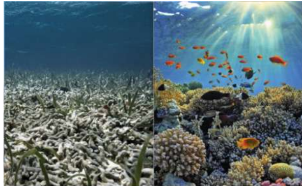
ESCALFAMENT DELS OCEANS