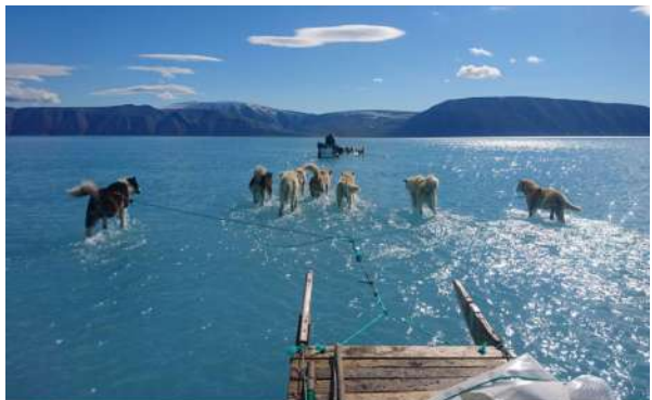
DESGLAÇ DE LES GLACERES