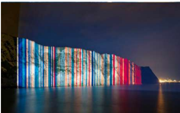
AUGMENT DE LA TEMPERATURA